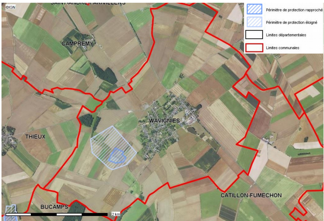
Carte publiée par l'application CARTELIE © Ministère de la Transition Écologique et Solidaire - CP2I (DOM/ETER)